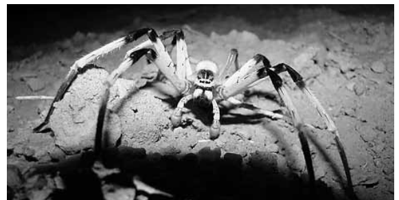
Aravan jahtihämähäkki.

Vaikka lajin yksilöitä on löydetty liian vähän, jotta olisi voitu selvittää sen biologista käytöstä tai lajin levinneisyyt-