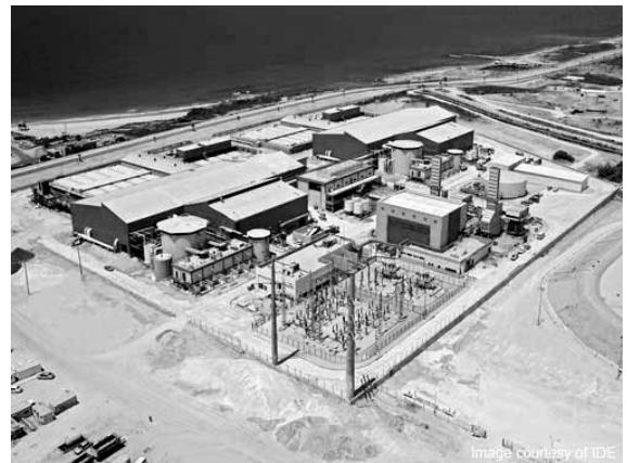
Ashkelonin suolanpoistolaitos ja sen viereen rakennettu voimala

Nykyisin Israel uudelleenkäyttää 75 % jätevedestään, ja siellä kehitetty pisarakastelutekniikka on myös pitkään ollut käytössä. Meriveden suolanpoistoon on käytössä kolme suolanpoistolaitosta, joista suurin sijaitsee Ashkelonissa. Se on maailman suurimpia ja tuottaa yli 100 miljoonaa m 3 makeaa vettä vuodessa, mikä on noin 13 % veden kulutussyynnästä Israelissa.