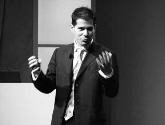
Shai Agassi

Välttämättömyyden pakosta syntynyt vesitekniiikan tietotaito antaa hyvän pohjan kansalliselle NEW Tech -ohjelmalle (Novel Efficient Water Technologies — uudet tehokkaat vesitekniiikat), jolla Israel lisää panostustaan vesitekniiikkaan aikana, jolloin sitä on monissa muissa maissa vähennetty. Kun vesipula mm. USAssa ja Australiassa on lisännyt tämän tekniikan kysyntää, Israelin vesitekniiikkaviennin arvoksi vuonna 2011 arvioidaan peräti 2,5 miljardia dollaria.