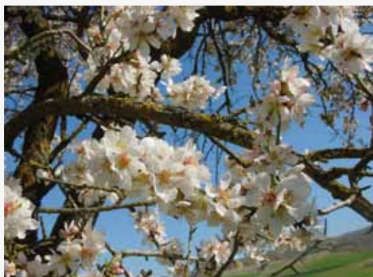
Mantelipuu kukassa puiden uudenvuoden aikaan (kuva: Wikimedia Commons). Ks. tu bišvat -kirjoitus s. 4.

Vastaava toimittaja: Reino Kurki-Suonio reino.kurki-suonio@tut.fi Toimituskunta: Mikael Enckell, Vesa Hirvonen, Juha-Pekka Rissanen, Sirku Salmela, Mila Westerberg. Ilmestyy: neljä kertaa vuodessa. Vuosikerta 15 euroa, kestitilaus 12 euroa. Ilmoitushinnat: 1/1 s. 170 euroa, 1/2 s. 95 euroa, 1/4 s. 55 euroa, 1/8 s. 35 euroa. Painopaikka: Painomerkki Oy, Helsinki. Taitto: Kirsi Pääskyvuori.