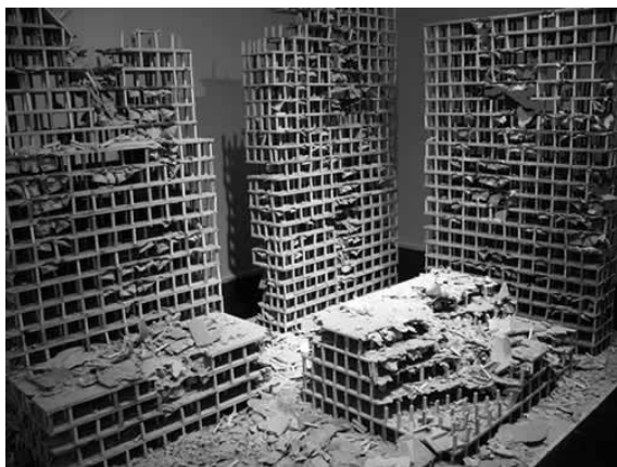
Venäläisen Peter Belyin installaatio Danger Zone