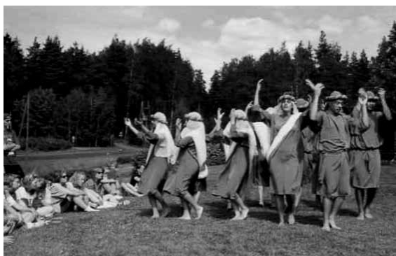
Jemenin juutalaisnuoria vantaalaisten vieraina 1991.

Olen ollut opettajana lähes 40 vuotta. Toiminta Vantaan Suomi-Israel -yhdistyksen ja liiton hallituksessa 1980-1990 -luvuilla autoivat näkemään asioita syvemmillä. Opin jotain siitä, mitä juutalaisena eläminen eri puolilla, erityisesti Israelissa, on. Sain monia lämpimiä ihmissuhteita. Opin ymmärtämään juutalaisen ruokapöydän ja -tapojen hienoutta. Ennen kaikkea tajusin erikoisaseman, joka on lyönyt leimansa ”Jumalan valitun kansan” taisteluun olemassaolostaan. Olen varma, että olen ollut parempi uskonnonopettaja puheenjohtajakauteni jälkeen.