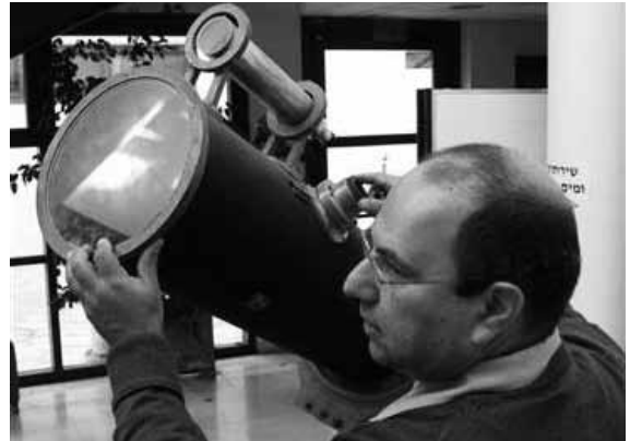
Einsteinin pitkään kateissa ollut tähtikaukoputki on nykyisin Jerusalemin heprealaisessa yliopistossa, jonka perustajia myös Einstein oli.

Kaksi myöhemmin löytynyttä planeettaa on tähän asti tunnettu vain kreikkalaisilla nimillä. Ben Ami sanoi, että hänen mielestään oli tullut aika "antaa nimet planeetoille, joita