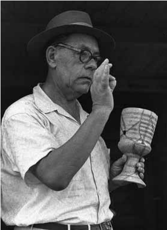
Professori Eleazar Sukenik (1889–1953).