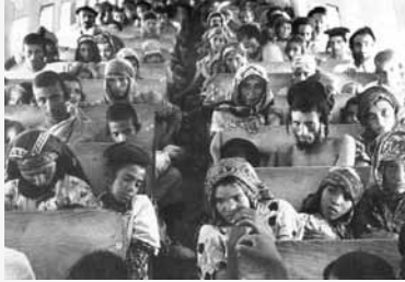
Operaatio "taikamatto".

Aluksi juutalaisilla oli vahva asema Himyarissa, joka oli yksi alueen kuningaskunnista. Monet sen asukkaat, jopa itse hallitsijaperhe, kääntyivät juutalaisuuteen, ja juutalaisuudesta tuli vallitseva uskonto. Tämä kesti vuoteen 525, jolloin Etiopian kristityt ottivat siellä vallan. Etiopian valta päättyi muslimivalloitukseen 600-luvulla, jolloin juutalaisista tuli "suojeltuja" toisen luokan kansalaisia. Heidän