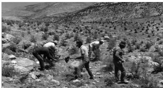
Keren Kajemet on menestyksellisesti taistellut aavikoitumista vastaan.

Israelilaiset tutkijat, jotka ovat seuranneet oliivipuiden vaikutusta Israelin autiomaiden ekosysteemiin, ovat havainneet, että oliivipuilla on kuivilla alueilla monia hyviä ympäristövaikutuksia. Sen lisäksi, että niistä saadaan oliiviöljyä, ne suojaavat villieläimiä, kuten muuttolintuja, jotka lentävät joka vuosi Israelin kautta. Ne puhdistavat ilmaa saasteista, kuten hiilidioksidista, toimivat jätteiden sijoituspaikkana, kun jätteet on kompostoitu, ja ne auttavat pitämään loitolla haitallisia eläimiä kuten shakaaleja.