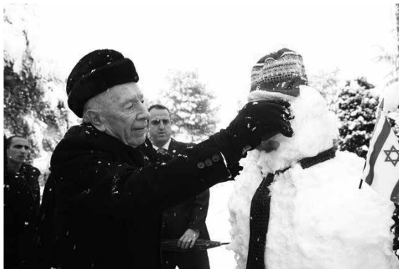
Presidentti Peres viimeistelee lumiukkoa.

Yli 700 puuta kaatui lumikuorman alla, jotkin lähiöt jäivät ilman sähköä. Raivaustyöt kestivät kauan. Tiepalvelu nosti ojasta kymmeniä ajoneuvoja, jotka olivat suistuneet tieltä.