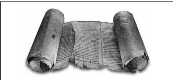
Ainoa kokonaisena säilynyt kirjakäärö, Jesajan kirja n. vuodelta 120 eKr.