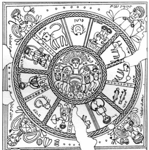
Beth Alphan eläinratamosaiikki.

Vuonna 1928 Hefzibah-kibbutsin maanviljelijät tekivät arkeologisia löytöjä. He kutsuivat paikalle arkeologeja Jerusalemissa, ja siitä lähtien on paikalla tehty kaivauksia moneen otteeseen. Arkeologit päättelivät, että paikalla oli muinainen synagoga. Nykyään sitä kutsutaan Beth Alphan synagogaksi. Löytynyt lattia on päällystetty mosaiikilla, jonka yksi kuvio kuvaa eläinrataa. Eläinradassa kaksosten merkki on talven lopussa Adar-kuun kohdalla.