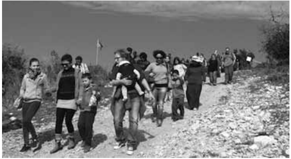
Israelissa tämänvuotiseen Tu bishvat -juhlan viettoon kuului suuri puunistutustapahtuma Karmel-vuorella. Tämä oli ensimmäinen kerta, kun sinne istutettiin puita kahden vuoden takaisen metsäpalon jälkeen. Kuvassa väkeä matkalla istutuspaikalle.

Suomen eduskunnassa on viime vuosikymmeninä useampaankin kertaan tehty kysely siitä, miten alueelle lähetetyt tuet edistävät rauhaa. Kansainväliset tutkimukset kertovat, että eräät oppikirjat ovat kuvanneet naapuria varsin kieltei-