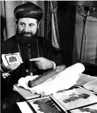
Metropoliitta Mar Samuel (1909–1995) Qumranin löytöjä tarkastelemassa.