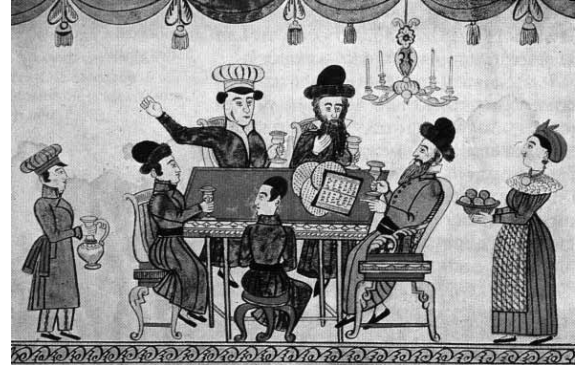
Ukrainan juutalaisia viettämässä pesahia 1800-luvulla.

Luetaan ääneen Haggada , liturginen teksti, joka kertoo Egyptistä lähdön yksityiskohtaisesti.