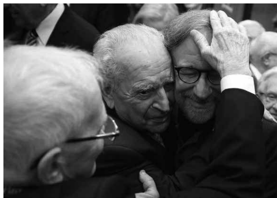
Steven Spielberg ja holokaustista selvinneitä.

H olokaustista selviytyneet eri puolilta maailmaa kokoontuivat Krakovaan päivää ennen Auschwitzin keskitysleirin vapautumisen 70-vuotisseremoniaa. Kokoontuminen saattaa olla viimeinen laatuaan, koska entiset vangit ovat jo hyvin iäkkäitä.