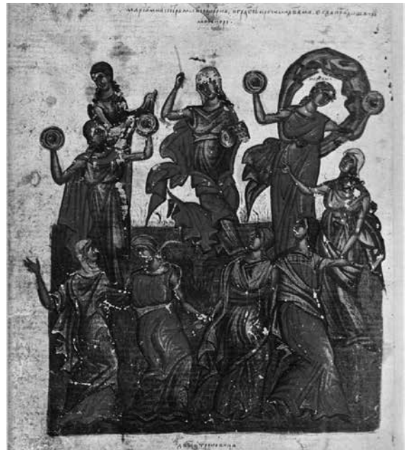
Mirjamin tanssi. Bulgarianlaisen psalttarin kuvitusta 1300-luvulta.

diasporaa eläneiden juutalaisten vähemmistöjen keskuudessa tanssituista seremoniallisista (hääjuhla-) tanssiperinteistä? Eli olisiko olemassa jokin juutalaisen tanssigenren "leimamerkki", ikäjoista alkaen säilynyt tyylipiirre, jonka voisi liittää omaan tanssiluomukseensa ja aikaansaada näin oikean