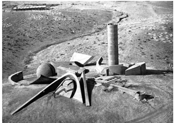
Negev-prikaatin muistomerkki (Dani Karavan).

W allpaper, yksi maailman huomattavimmista design-julkaisuista, omisti osan tammikuun 2015 numerostaan Israelille. Lehti keskittyi uusiin suunnittelijoihin ja esitteli maan johtavia arkkitehtejä.