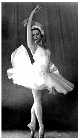
Maya Plisetskaya (s. 1925).

sisäistäneet aikakauden ekspressionistisen tanssi-ilmaisun, Ausdrucksanz (ilmaisutanssi). Pyhälle maalle kulkeutuivat siis samanaikaisesti sekä ikivanha Euroopan juutalainen perhekeskeinen yhteiskulttuuri että uudenlaista yhteiskuntaa rakentamaan aikovien nuorten poliitikoiden kaaderit ja huippumodernein aatoksinkin varustautuneet kaupunkikulttuurin kasvatit, emansipoituneet tanssijattaret.