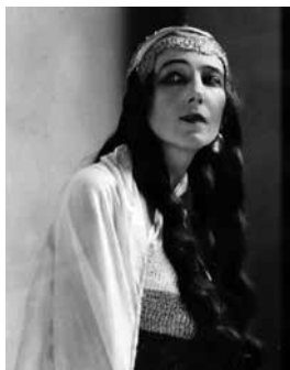
Ida Rubinstein (1885–1960).

Modernissa juutalaisvaltiossa luotu uusi musiikki ja tanssi perustuivat eri tahoilta Euroopasta ja Lähi-idästä maahan hakeutuneiden siirtolaisten muassaan tuomien kansanperinteiden yhteensovittamiseen. Ammattisäveltäjät ja -tanssijat pyrkivät aikaansaamaan uuden israelilaisen sävelkielen ja tanssityylin, joten monipuoliselle innovatiivisuudelle oli kysyntää. Jemenistä muuttaneiden juutalaisten osuudella oli tässä perinteisten kulttuuripiirteiden fuusioitumisessa merkittävä asema, samoin kuin myös paikallisella arabimusiikin rytmikalla. Maahan oli muuttanut etenkin Saksasta 1920- ja 1930-luvuilla nuoria ja innokkaita naistanssijoita, joista useimmat olivat saaneet oppia myös Weimarin Saksan ”uuden tanssin papittarelta”, Mary Wigmanilta , eli he olivat