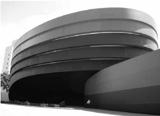
Holonin Design-museo (Ron Arad).