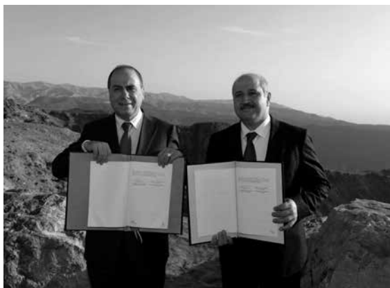
Israelin vesi- ja energiahuoltoministeri Silvan Shalom (vas.) ja hänen jordanielainen kollegansa Hazim El-Naser esittelevät tuoretta sopimusta.

Nykyisin Kuolleenmeren pinta alenee noin metrin vuodessa, ja ilman tätä lisävettä meri tulisi arvioiden mukaan kuivumaan lopullisesti vuoteen 2050 mennessä. Kun Kuol-