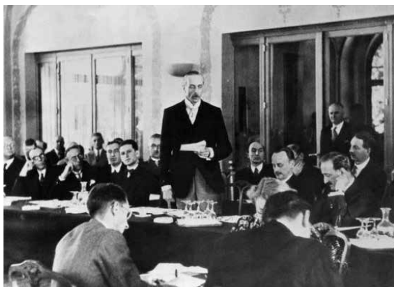
Evianin konferenssissa pidettiin monia puheita, joissa juutalaispakolaisten vastaanottamista torjuttiin.

Konferenssin jälkeisiä tunnelmia kuvaa hyvin myös Meirin toteamus lehdistölle: ”On vain yksi asia, jonka toivon näkeväni ennen kuin kuolen, ja se on, ettei minun kansani pitäisi enää tarvita myötätunnon osoituksia.”