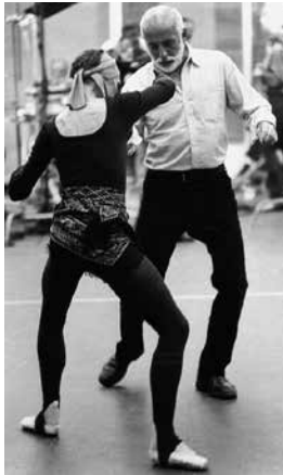
Jerome Robbins (1918–1998) harjoittelee Natalia Makarovin kanssa.

Mirjam ei ensinnäkään ollut mikään ihan nuori neitokainen enää, vaan lähenteli joidenkin laskelmien mukaan varsinkin kypsää kahdeksankymmenen vuoden ikää, joten kuvitelmat vauhdikkaista tanssahteluista, ainakaan hänen kohdallaan, olivat tuskin todellisuutta. Myöskään riehakkaan hurmokselliset