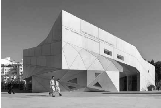
Tel Avivin taidemuseon uusi siipi (Preston, Scott ja Cohen).