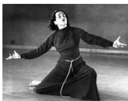
Mary Wigman (1886–1973).