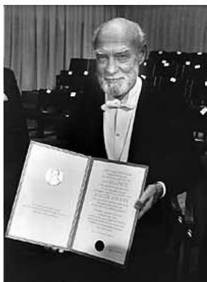
Roger W. Sperry (1913–1994) esittelee Nobel-palkinnon kunniakirjaa vuonna 1981.

Siis mene itseesi, tunteisiisi, perimmäisiin motiiveihisi. Eläydy asiaan kokonaisvaltaisesti äläkä jankuta. Älä puhu niin paljon!