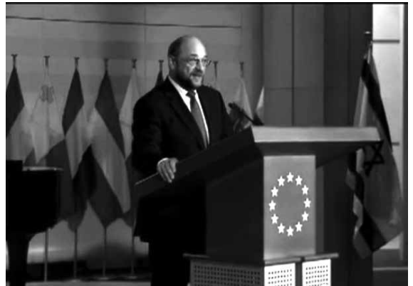
Euroopan parlamentin puhemies Martin Schultz puhuu holokaustin muistotilaisuudessa EU:ssa.

Euroopan parlamentin puheenjohtaja Martin Schultzin puhe oli siinä ilmaistujen ajatusten kannalta erityisen mer-