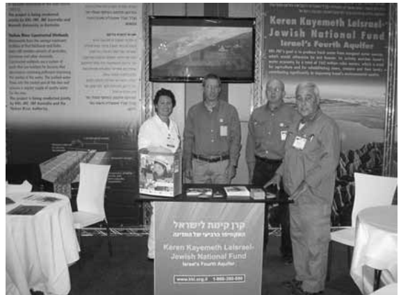
KKL-JNF:n osasto Watec-näyttelyssä.

Israelia pidetään alan johtavana maana veden kierrätyksessä muun muassa sen ansiosta, että KKL-JNF on ra-