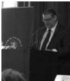
Uskontojen välisen yhteistyön seminaarissa viime toukokuussa avauspuheen piti ulkoministeri Timo Soini.

Viime aikojen ikävät tapahtumat, ennen muuta lukuisia kuolonuhreja vaatineet terrori-ot ovat herättäneet voimakastakin keskustelua uskontojen roolista maailmassa. Tämän puolen ovat nostaneet esille erityisesti monien terrori-iskujen liittäminen yhteen islamin kanssa. Vaikka monet islamilaiset johtajat ovat selkeästi sanoutuneet irti terrorismista, ääri-islamisuus – siis uskonto – liitetään edelleen näihin tekoihin.